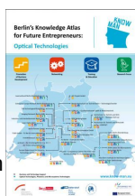
Neu: KnowMan Wissensatlas