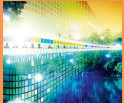
Die intelligente Stadt: Marktchancen für IT-Unternehmen