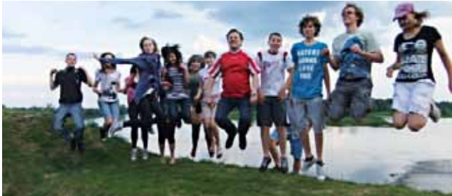
Oderland-Jugendrat: Mit Kreativität und frischen Ideen gegen die Abwanderung junger Leute