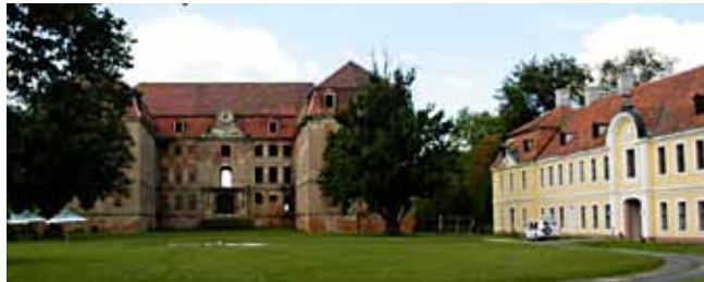
Schloß Brody (Pforten) – gemeinsames kulturelles Erbe

In diesem Jahr strebt der ZVON zur Weiterentwicklung des grenzüberschreitenden ÖPNV und des EURO-NEISSE-Tickets einen Qualitätssprung an: Die bisher ausschließlich freiwillige operative Zusammenarbeit mit den ÖPNV-Aufgabenträgern in Polen und Tschechien soll institutionalisiert und damit verbindlich gemacht werden.