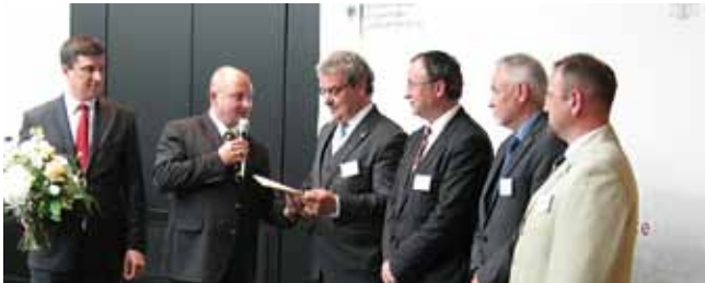
Staatssekretär Bomba überreicht den Vertretern des Europäischen Parkverbands Lausitz ihre Auszeichnung

Das EURO-NEISSE-Ticket ist als eines von fünf Gewinnerprojekten als modellhaftes deutsch-polnisches Kooperationsprojekt ausgezeichnet worden. Im Rahmen einer Feierstunde am 21. Mai in Berlin überreichten Staatssekretär Rainer Bomba (Bundesministerium für Verkehr, Bau und Stadtentwicklung) und Vizeminister Marcei Niezgoda (Ministerium für Regionalentwicklung der Republik Polen) den Vertretern der fünf Gewinnerprojekte der zweiten Auflage des Wettbewerbs die Auszeichnungen für modellhafte deutsch-polnische Kooperationsprojekte.