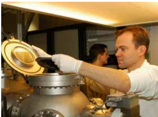
Substratbestückung an einer UHV-Präzisionsbeschichtungsanlage

Die Senatsverwaltung für Wirtschaft, Technologie und Forschung des Landes Berlin und das polnische Nationale Zentrum für Forschung und Entwicklung (NC-BiR), ein Projektträger des polnischen Bildungsministeriums, haben am 20. August ein Kooperationsabkommen unterzeichnet.