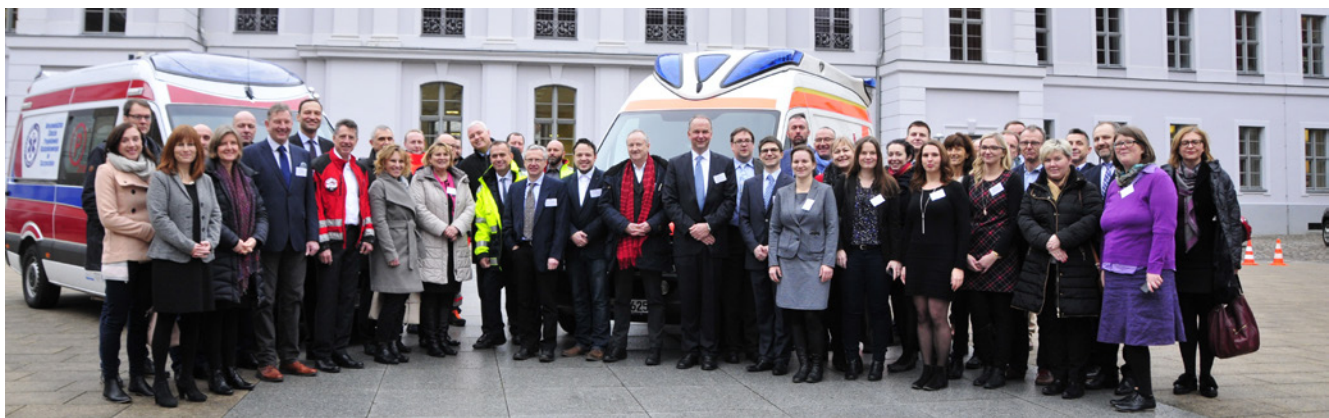
Alle ziehen an einem Strang: Dieses Konsortium setzt sich für einen rechtssicheren grenzüberschreitenden Rettungsdienst ein