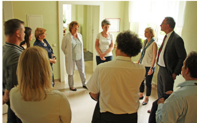
Besichtigung der Entgiftungsstation im Sächsischen Krankenhaus Arnsdorf

Im Gegenzug besuchten Mediziner*innen aus Sachsen im Oktober 2017 ihre polnischen Kolleg*innen im Niederschlesischen Zentrum für Psychische Gesundheit in Breslau. Das Ergebnis