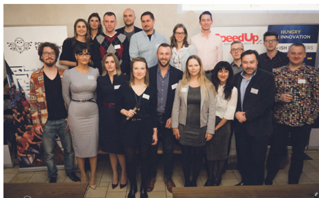
Veranstalter der Polish Tech Night mit den Gewinnern – Start-ups aus der Pitch Runde der dritten Ausgabe