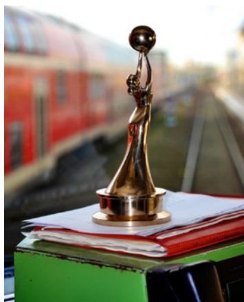
Der Kulturzug räumt den 12. Europäischen Kulturmarken-Award in der Kategorie „Europäische Trendmarke des Jahres 2017“ ab.

Der Kulturzug Berlin/Breslau lädt seine Fahrgäste auf eine spannende Reise zwischen zwei Städten, zwei Ländern und zwei Kulturen ein. Nun wurde dieses einmalige Angebot im Zeichen der deutsch-polnischen Verständigung mit dem 12. Europäischen Kulturmarken-Award in der Kategorie „Europäische Trendmarke des Jahres 2017“ ausgezeichnet.