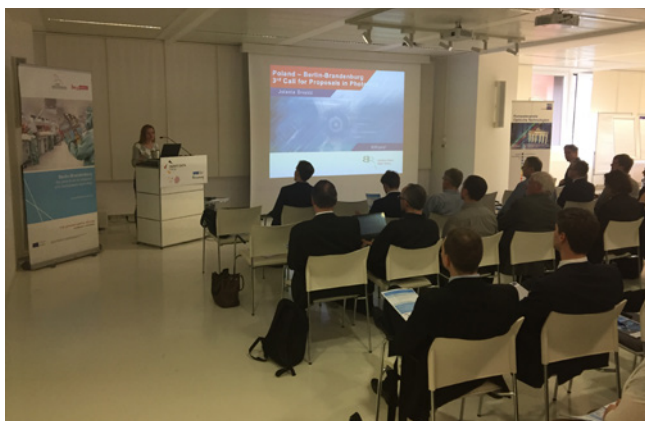
PHOENIX+ Workshop im Februar 2017 als Vorbereitung für die Förderausschreibung des BMBF zum Schwerpunkt „Photonik für die Digitalisierung“

Wirtschaftsbezogene und grenzüberschreitenden Forschungs- und Entwicklungskooperationen im Bereich der Optischen Technologien initiieren und unterstützen – dieser Aufgabe widmet sich das Photonics and Optoelectronics Network PHOENIX+, ein Projekt des Clusters Optik & Photonik. Dabei fokussiert es sich vor allem auf Kooperationen zwischen Akteuren aus der Hauptstadtregion und den Partnerregionen in Polen, Japan, Brasilien und den USA.