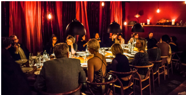
Anregende Gespräche beim Polish Thursday Dinner im Oktober 2017 in der Cordobar in Berlin-Mitte.

Bei den Polish Thursday Dinners geht es international und bunt gemischt zu. Polen sind eher eine Seltenheit, dafür trifft man Mexikaner, Kanadier, Franzosen und natürlich auch Berliner – im Prinzip alle, die die polnische Kultur kennenlernen möchten. Der Austausch findet meistens auf Englisch statt.