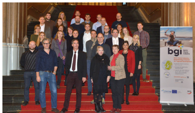
Das BGI-Konsortium bei der Kick-Off-Veranstaltung im November 2017 im Berliner Rathaus

Langfristig soll sich die Region zu einem internationalen Hotspot der digitalen Spieleindustrie entwickeln. Mehr unter www.baltic-games.eu .