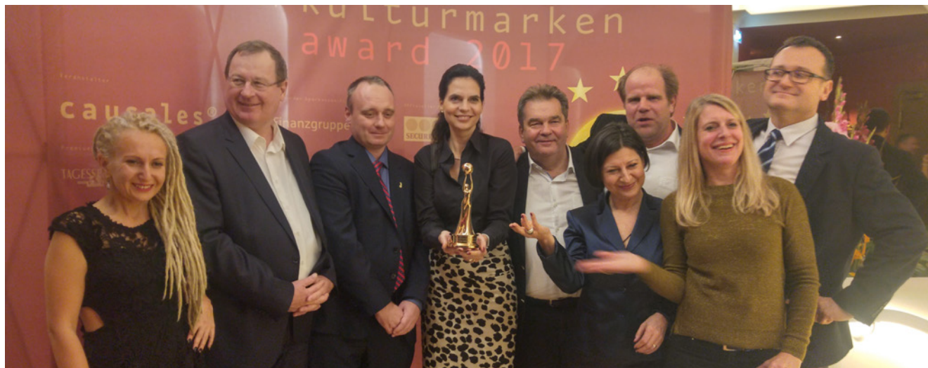
Das sind die glücklichen Gewinner des Europäischen Kulturmarken-Awards

Das aktuelle Programm ist abrufbar unter www.vbb.de/kulturzug und über die Facebook-Seite des Kulturzugs www.facebook.com/vbbpolen .